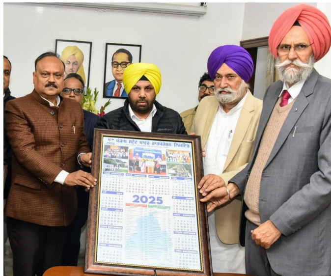
निगम की प्रतिबद्धता का प्रतीक है। दूसरी तरफ, पीएसटीसीएल का कैलेंडर राज्य में पावर ट्रांसमिशन के बुनियादी ढांचे को