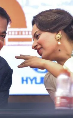
स्क्रीनिंग को मिली प्रतिक्रिया 'उत्साहजनक' है। फिल्म में श्रेयस तलवार ने युवा अटल बिहारी वाजपेयी, मिलिंद सोमन ने फील्ड मार्शल सैम मानेकशां, महिमा चौधरी ने पुपुल जयकर और सतीश कौशिक ने जगजीवन राम की भूमिका निभाई है।

नयी दिल्ली, अभिनेत्री और भाजपा की सांसद कंगना रनौत ने के फिल्म की पहली विशेष के दीय मंत्री नितिन गडकरी के लिए अपनी आगामी फिल्म 'एमरजेंसी' की विशेष 'स्क्रीनिंग' आयोजित की। गडकरी ने नागपुर में फिल्म देखी जिसमें पूर्व प्रधानमंत्री इंदिरा गांधी की भूमिका में हैं। रनौत द्वारा निर्देशित, निर्मित और लिखित 'एमरजेंसी' में अनुपम खेर भी हैं। विवादों में घिरी यह फिल्म 17 जनवरी को रिलीज होगी। गडकरी ने 'एक्स' पर एक पोस्ट में लोगों से फिल्म देखने का आग्रह किया। रनौत ने 'एक्स' पर लिखा, 'अपना कीमती समय देने लिए बहुत-बहुत धन्यवाद सर।' 'एमरजेंसी' में जयप्रकाश नारायण की भूमिका निभाई है।