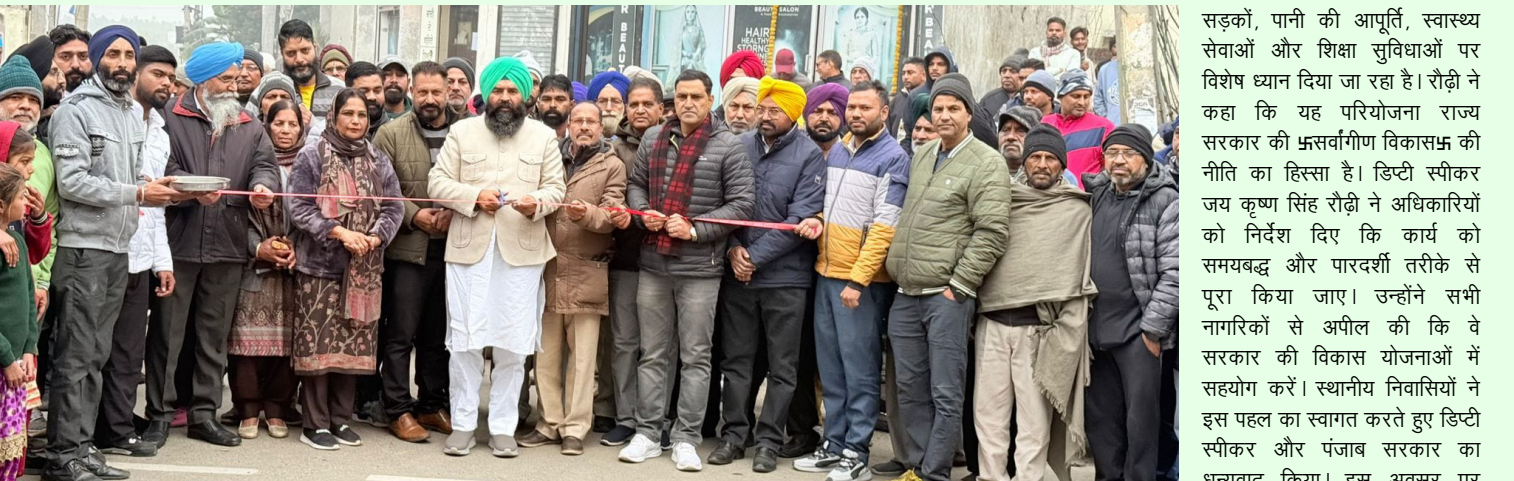
और व्यापारिक गतिविधियों में भी तेजी आएगी। यह विकास कार्य क्षेत्र के किसानों, व्यापारियों और आम जनता के लिए वरदान साबित होगा। उन्होंने बताया कि पंजाब सरकार ने गढ़शंकर क्षेत्र में बुनियादी ढांचे को मजबूत बनाने के लिए व्यापक योजना बनाई है। इस योजना के तहत, विभिन्न विभागों के अधिकारी व क्षेत्र के गणमान्य लोग भी उपस्थित थे।

एस. के. सक्सेना माहिलपुर/होशियारपुर, डिप्टी स्पीकर पंजाब विधानसभा जय कृष्ण सिंह रौढ़ी ने आज उपमंडल गढ़शंकर के माहिलपुर में 2 करोड़ 15 लाख रुपए की लागत से बनने वाली सड़कों के निर्माण कार्य का शुभारंभ किया। डिप्टी स्पीकर ने इस अवसर पर स्थानीय निवासियों को संबोधित करते हुए कहा कि राज्य सरकार प्रदेश के विकास के लिए प्रतिबद्ध है। उन्होंने कहा कि नगर पंचायत चुनावों के दौरान उन्होंने जो सड़कें बनाने का वादा किया था, उन्हें पूरा कर रहे हैं। उन्होंने कहा कि इन सड़कों के निर्माण से न केवल गांवों को बेहतर सड़क संपर्क मिलेगा, बल्कि कृषि